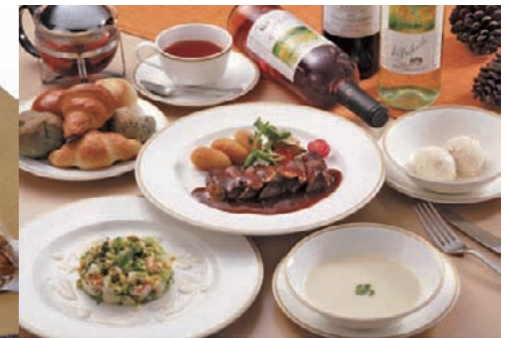
フレンチコース（ディナー）ペアお食事券