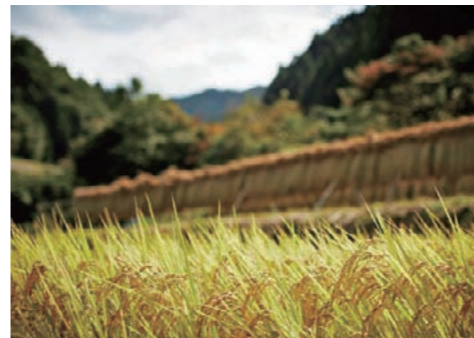
明日香村産ヒノヒカリ（飛鳥米）