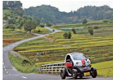
超小型モビリティ「MICHIMO」レンタルサービス利用券

6,000円以上のご寄附をしていただいた方へ、御礼として明日香村の特産品をお送りしています。下記の写真はその一例です。