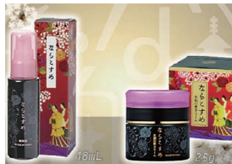
ならこすめ（明日香村産ヤマトトウキ使用）