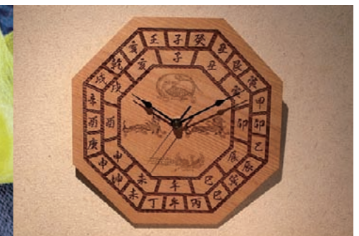
四神の時計（クォーツ）