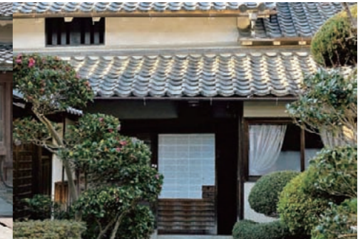
「飛鳥の民館」1泊2食ペア宿泊券