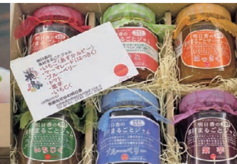
明日香素材まるごとジャム