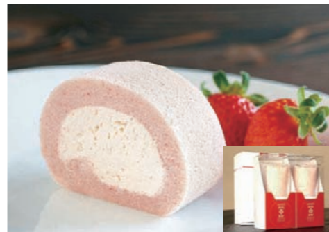
あすかりピーのロールケーキ