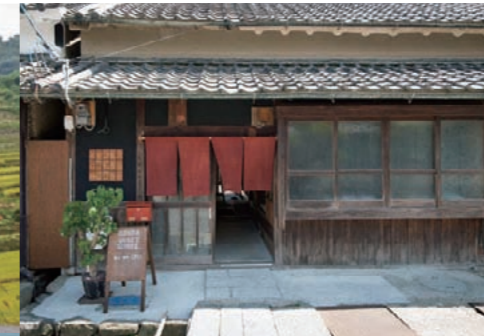
「ASUKA GUEST HOUSE」蔵個室1泊2食ペア宿泊券